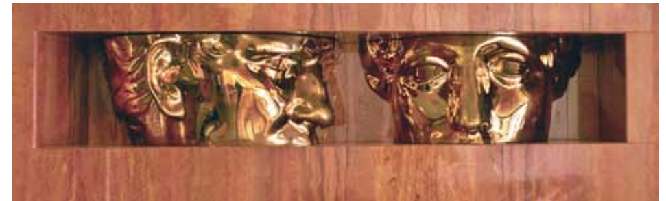
“ Le visage de l'autre ”, œuvre de Sacha Sosno, située dans le hall d'entrée de l'Institut.